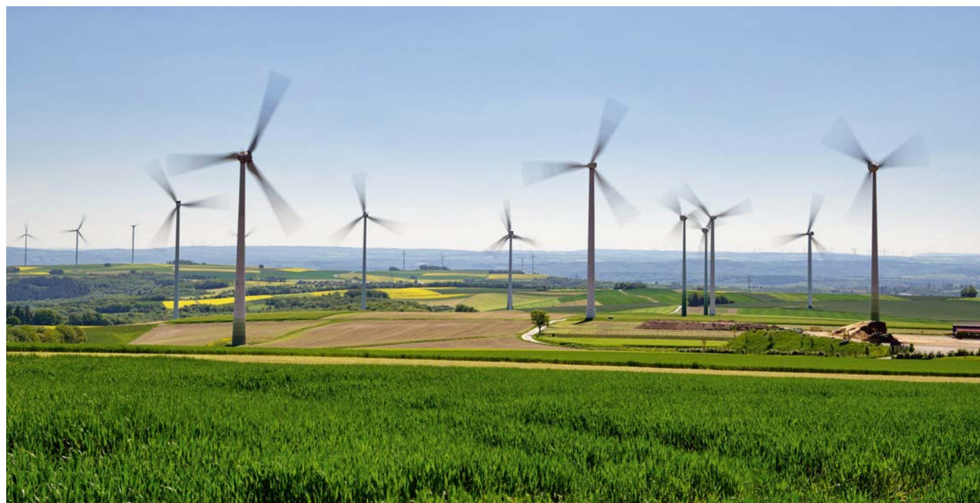
Erneuerbarer Gewinn Windräder von Vestas drehen sich im Windpark von Clearvise bei Dungenheim. Mit beiden Aktien können Nachhaltigkeitsfonds im Ranking punkten