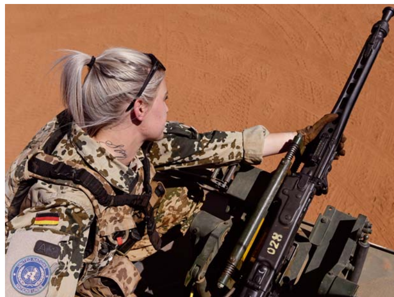
Auf der Abschussliste Rheinmetall liefert der Bundeswehr Sturmgeschütze. Die Aktie bringt Nachhaltigkeitsfonds im Ranking Minuspunkte

zu erzielen. Der Spitzenreiter in der Kategorie offensiv&flexibel namens FUNDament Total Return überzeugt mit einem sehr niedrigen maximalen Verlust von nur 5,5 Prozent, für jeden denkbaren Ein- und Ausstiegstag in den vergangenen drei Jahren. Der Fonds ist nicht ausdrücklich als nachhaltig gekennzeichnet und erreicht in dieser Wertung auch nur die Mindestpunktzahl von 70. Am Stichtag 30. Juni hielt er mit geringem Anteil auch den Rüstungshersteller Rheinmetall und Ölkonzern BP.